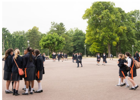
Les récréations se déroulent dans le parc.

Ces résultats illustrent la vocation des maisons d'éducation : offrir à des élèves motivées et méritantes des conditions de travail bénéfiques, favoriser l'ouverture intellectuelle dans un cadre d'éducation rigoureux, encourager l'effort individuel et la dynamique collective. Sont cultivées les valeurs communes des ordres nationaux : estime de soi, respect des autres, civisme, effort et, naturellement, mérite.