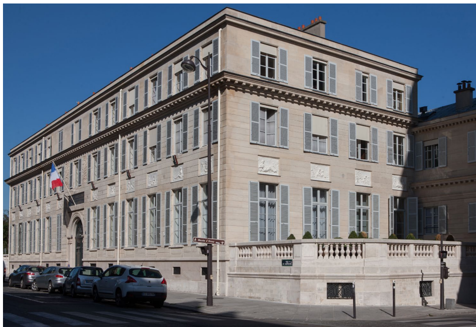
Le siège de la grande chancellerie de la Légion d'honneur à Paris.

C'est aussi la grande chancellerie qui veille à ce que seules les décorations officielles, françaises et étrangères, soient usitées. En effet, un Français ne peut porter ou même accepter de recevoir une décoration étrangère sans en avoir obtenu l'autorisation auprès de l'institution.