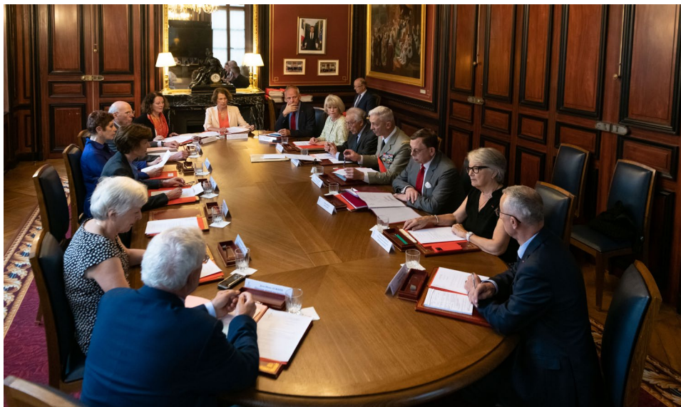
Les membres des conseils exercent un mandat de quatre ans renouvelable.

Il existe un conseil pour l'ordre de la Légion d'honneur, qui examine en outre les propositions d'attribution de la Médaille militaire et de la Médaille nationale de reconnaissance aux victimes du terrorisme, et un conseil pour l'ordre national du Mérite. Ces instances délibératives, présidées par le grand chancelier, sont respectivement composées de 16 et 12 personnalités choisies parmi les membres des ordres nationaux et représentatives de tous les secteurs d'activité. Ce sont les membres des conseils qui étudient les mémoires de proposition établis par les ministres et qui sont répartis suivant leur domaine de compétence. Les conseils délibèrent également sur les cas de décorés qui auraient failli à l'honneur. La procédure disciplinaire contradictoire qui se met alors en place peut aller jusqu'à l'exclusion de l'ordre. Les conclusions des conseils sont soumises à la décision du Président de la République.