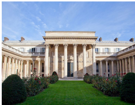
Le palais de la Légion d'honneur, édifié au XVIII e siècle, est le siège de l'ordre depuis 1804.