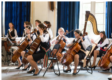
L'enseignement de la musique est une tradition dans les maisons d'éducation.

Un système de récompense, mis en place dès la création des maisons d'éducation en 1805 par Napoléon I er , continue de constituer une source d'émulation morale et scolaire pour les élèves.