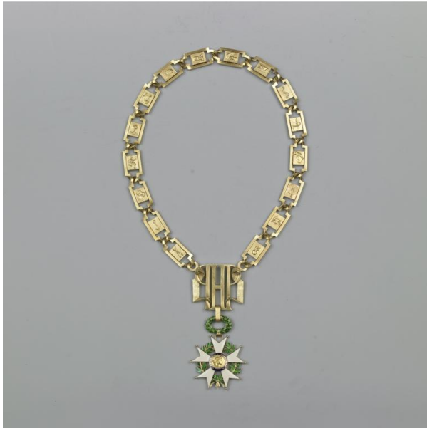
Le collier actuel de grand maître de la Légion d'honneur