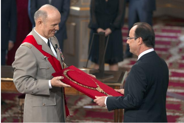
Le grand chancelier présente le grand collier au Président de la République lors de la cérémonie d'installation, le 15 mai 2012.