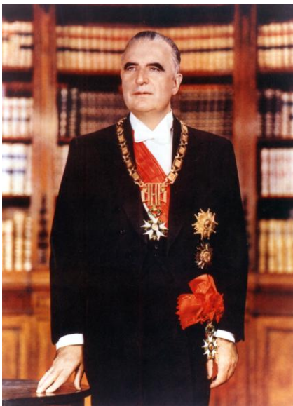
Portrait officiel de Georges Pompidou, Président de la République française (1969-1974)