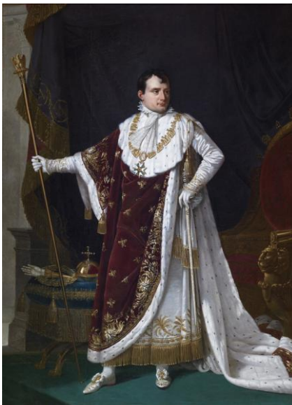
Robert Lefevre (1755-1830)